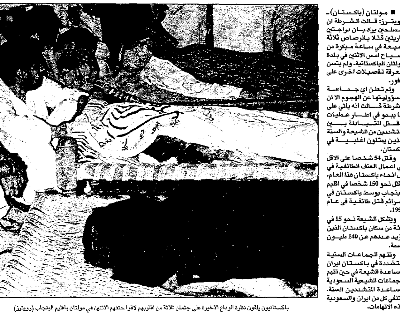
باكستانيون يلقون نظرة الوداع الأخيرة على جثمان ثلاثة من اقربهم لاقوا حتفهم الاثنين في مولتان بالقليم البنجاب